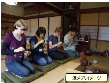
浜メグリイメージ

「浜メグリ」は越前浜と角田地区に工房を構えている美術・工芸などの作家たちの自主企画展を合同開催するイベントです。古民家や蔵なども点在する古い歴史を持つ集落を、のんびり歩いてみませんか？