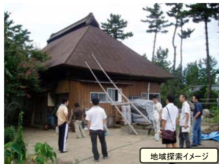
地域探索イメージ